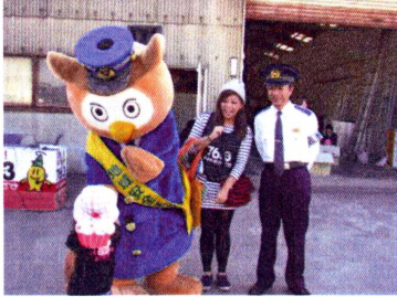
ファーマーズマーケットにて 広報啓発活動