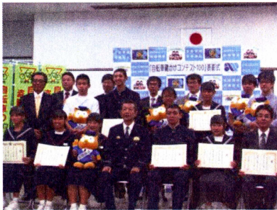
自転車かぎかけコンテスト 表彰式

10月に行われた、秋の安全なまちづくり県民運動期間中、特殊詐欺被害防止をはじめ、各種犯罪被害防止の広報啓発活動を行いました。