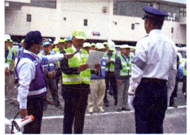
青パト一斉パトロール 出発式