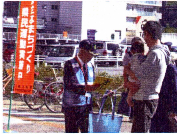
ウィングタウンにて 広報啓発活動