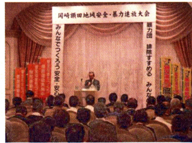
地域安全・暴力追放大会

10月に行われた、秋の安全なまちづくり県民運動期間中、特殊詐欺被害防止をはじめ、各種犯罪被害防止の広報啓発活動を行いました。