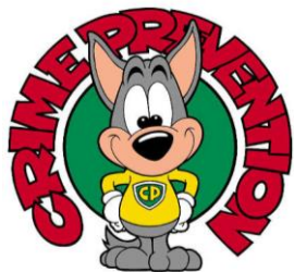
防犯マスコット『CPくん』